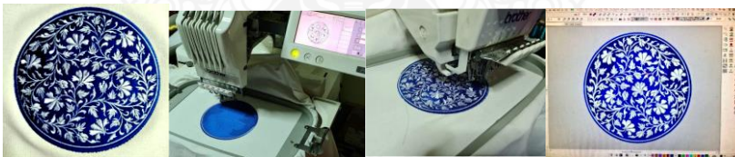
ภาพที่ 4 ขั้นตอนการปักลายดอกโบตั๋น

4.1.1 การปักลายดอกโบตั๋น กระเป๋ามีขนาดเส้นผ่านศูนย์กลาง 7 นิ้ว การตกแต่งลายครามบนกระเป๋าผ้าแคนวาสสีขาวด้วยการปักคอมพิวเตอร์จึงมีขนาดเส้นผ่านศูนย์กลาง 6 นิ้ว ด้วยการร่างแบบลายดอกโบตั๋น ลงบนโปรแกรม PE-DESIGN ให้เครื่องปักคอมพิวเตอร์ปักตามแบบร่าง