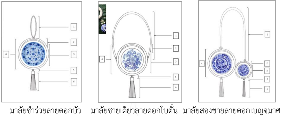
ภาพที่ 1 มาลัยขำร่วงลายดอกบัว มาลัยชายเดี่ยวลายดอกโป๊ตั้น และมาลัยสองชายลายดอกเบญจมาศ