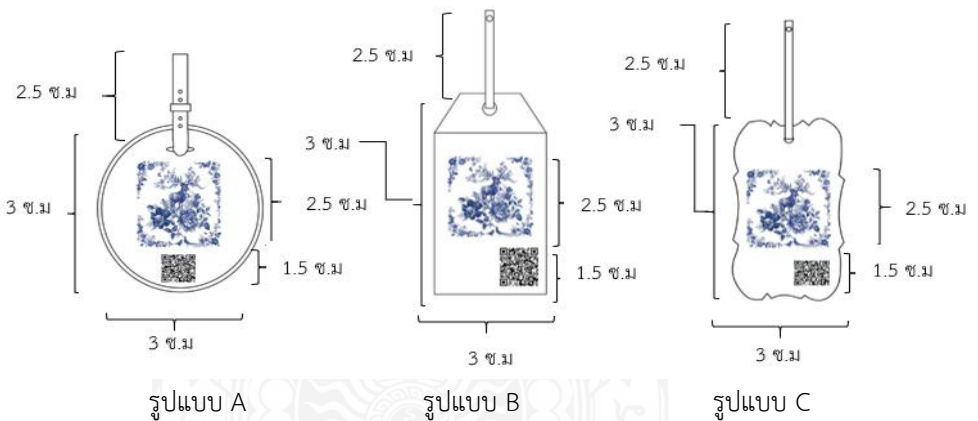
ภาพที่ 2 รูปแบบแท็กกระเป่าที่มีคิวอาร์โค้ด (QR Code) เกี่ยวกับสถานที่ท่องเที่ยวทาง ประวัติศาสตร์เครื่องลายครามในพื้นที่เกาะรัตนโกสินทร์