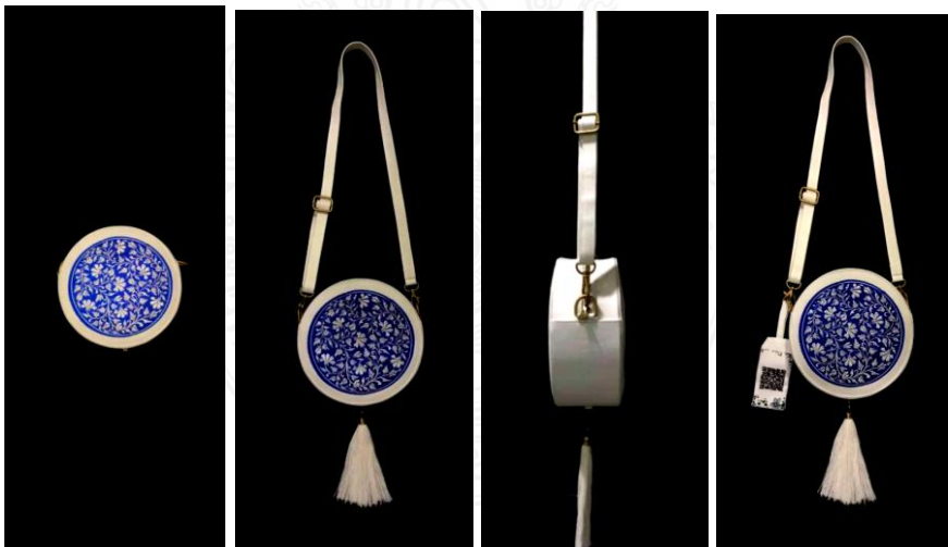
ภาพที่ 5 ผลงานสำเร็จ

4.1.4 การสร้างแท็กกระเป๋า รูปแบบกระเป๋ามาลียาขยเดี่ยวลายดอกโบตันนั้นเป็นรูปแบบทรงกลมแท็กกระเป๋าจึงเป็นรูปสี่เหลี่ยมผืนผ้าขนาด 2 \times 3 นิ้ว สายคล้องความยาว 0.5 \times 3 นิ้ว (เมื่อคล้องกับกระเป๋าสายคล้องจะมีขนาดความยาว 0.5 \times 1.5 นิ้ว) ขั้นตอนการสร้างแท็กกระเป๋า 1) การสร้างแท็ก QR Code โดยใช้โปรแกรม PUBHTML 5 นำข้อมูลใน ADD New Book รอโหลดไฟล์ และกดแชร์ กด Share This Book กด QR Code จะได้รับรหัสหรือเครื่องหมายคิวอาร์โค้ด (QR Code) 2) นำรหัสหรือเครื่องหมายคิวอาร์โค้ด (QR Code) ร่างแบบลงโปรแกรม PE-DESIGN พร้อมการตกแต่งลายครามให้เครื่องปักคอมพิวเตอร์ปักตามแบบร่าง สีเหลืองจตุรัสขนาด 1.5 นิ้ว บนผ้าแคนวาสสีขาวขนาด 5 \times 7 นิ้ว 3) การทำโครงสร้างแท็กกระเป๋าด้วยแผ่นพลาสติกความหนา 0.8 มิลลิเมตร นำผ้าแคนวาสสีขาวที่ปักคิวอาร์โค้ด (QR Code) เรียบร้อยแล้ว หุ้มแผ่นพลาสติก และเย็บปิดให้เรียบร้อย 4) เจาะผ้าที่จะคล้องสายขนาดความยาว 0.5 นิ้ว และเย็บรอบรอยเจาะ 5) ตัดผ้าแคนวาสสีขาวทำเป็นสายคล้องความยาว 1 \times 4 นิ้ว เย็บเก็บขอบข้างละ 0.5 นิ้ว เมื่อเสร็จนำไปคล้องกับสายสะพายกระเป๋า