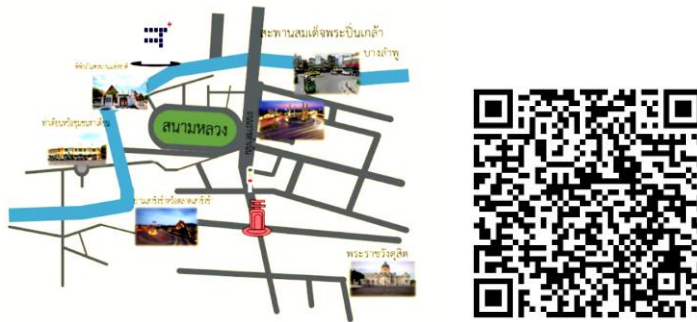
ภาพที่ 6 แผนที่และข้อมูล QR Code การท่องเที่ยวในเกาะรัตนโกสินทร์

4.2 การวิเคราะห์ข้อมูลความพึงพอใจของกลุ่มเป้าหมายที่มีต่อกระเป๋ามาลัยลายคราม : วัฒนธรรมคุณค่าสู่มูลค่าของที่ระลึกเชิงสร้างสรรค์เพื่อการท่องเที่ยวในเกาะรัตนโกสินทร์