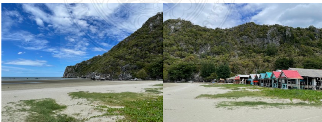
ภาพที่ 4 หาดบางปูที่ใช้เป็นท่าขึ้นเรือไปยังหาดแหลมศาลาและถ้ำพระยานคร