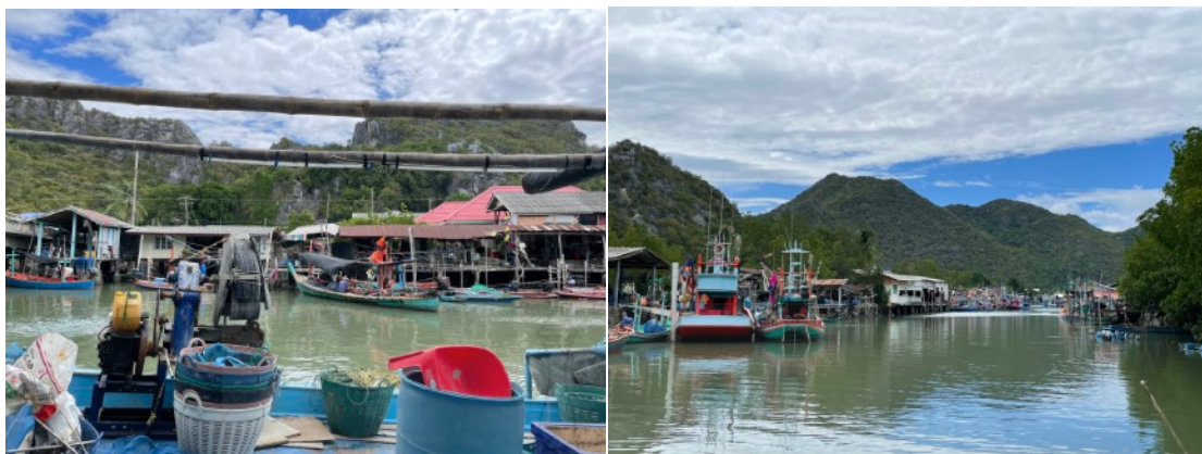
ภาพที่ 2 ลักษณะของอาคารบ้านเรือนภายในชุมชนบ้านบางปูและเรือชนิดต่างๆที่ใช้ในการทำประมง