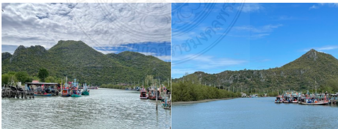
ภาพที่ 1 ภูมิทัศน์ของสภาพแวดล้อมทางธรรมชาติโดยรอบของชุมชนบ้านบางปู

เนื่องด้วยตำแหน่งที่ตั้งของชุมชนที่อยู่ในเขตอุทยานแห่งชาติเขาสามร้อยยอด ประกอบกับการมีสถานที่ท่องเที่ยวสำคัญในอาณาบริเวณโดยรอบของชุมชน จึงทำให้ชุมชนชาวประมงบ้านบางปู มีนักท่องเที่ยวแวะเวียนเข้ามาเป็นจำนวนมาก ชาวบ้านในชุมชนก็เริ่มมีการปรับเปลี่ยนวิถีชีวิต จากเดิมที่มีเพียงการทำประมงพื้นบ้านเพื่อเป็นอาหารและจำหน่ายไปยังตลาดเพื่อเป็นรายได้ ก็เริ่มมีการปรับเปลี่ยนเป็นการจำหน่ายสัตว์ทะเลทั้งในรูปแบบของสดและแปรรูป ให้กับนักท่องเที่ยวที่ผ่านไปมารวมถึงมีการปรับเปลี่ยนที่พักอาศัยเป็นโฮมสเตย์ เพื่อรองรับนักท่องเที่ยวที่สนใจเข้ามาพักผ่อนและเรียนรู้วิถีชีวิตชาวประมงพื้นบ้าน จึงสร้างให้เกิดอาชีพใหม่ๆและการเปลี่ยนแปลงภายในชุมชนที่สอดคล้องกับรูปแบบการท่องเที่ยวและสังคมสมัยใหม่มากขึ้น