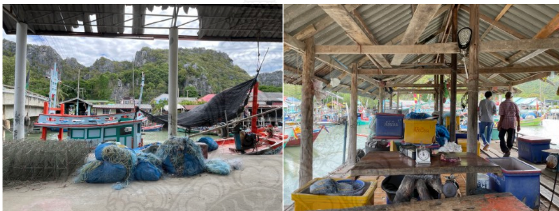
ภาพที่ 3 ท่าเทียบเรือ และพื้นที่ที่ใช้สำหรับแลกเปลี่ยนซื้อขายสัตว์ทะเล