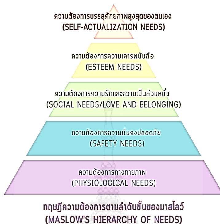
ภาพที่ 2 ทฤษฎีลำดับความต้องการของมาสโลว์ (Maslow)