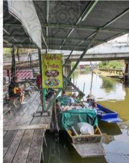
ภาพที่ 2.3 ตลาดวัดตะเคียน จังหวัดนนทบุรี

ที่มา: เว็บไซต์ การท่องเที่ยวแห่งประเทศไทย (2568)