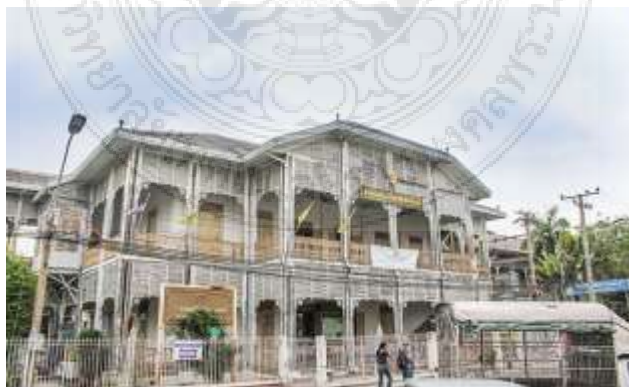
ภาพที่ 2.5 พิพิธภัณฑน์นนทบุรี ชุมชนทำน่านนท์

ดังนั้น แหล่งท่องเที่ยววิถีชีวิต จังหวัดนนทบุรี ส่วนใหญ่จึงเป็นแหล่งท่องเที่ยวที่นำเสนอวิถีชีวิตของชาวบ้านริมน้ำ การทำการเกษตร และการปั้นเครื่องปั้นดินเผา ซึ่งเป็นวิถีชีวิตที่สืบทอดกันมาจากอดีตจนถึงปัจจุบัน และเป็นจุดเด่นที่เป็นเอกลักษณ์ของจังหวัดนนทบุรี