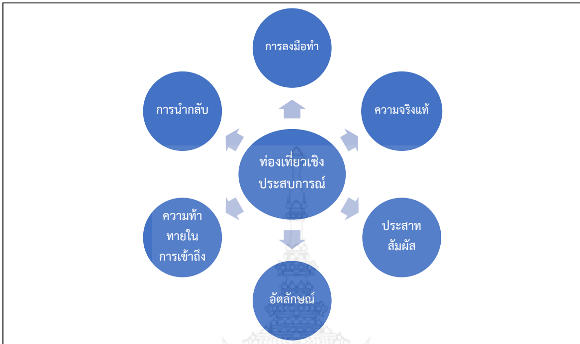
ภาพที่ 2.1 องค์ประกอบของการท่องเที่ยวเชิงประสบการณ์