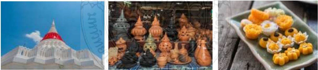
ภาพที่ 2.4 แหล่งท่องเที่ยวเกาะเกร็ด จังหวัดนนทบุรี

นอกจากนี้ ภายในชุมชนยังขึ้นชื่อเรื่องการทำขนมอาหารว่าง ขนมไทย และขนมไทยโบราณตามสูตรชาวมอญ นักท่องเที่ยวสามารถล่องเรือรอบเกาะ ไปเยี่ยมชมจุดบ้านทำขนมหวาน ร่วมเรียนรู้และลงมือทำขนมหวานด้วยตนเอง หรือเลือกซื้อตามอัยยาศัย และสัญลักษณ์สำคัญอันเป็นศูนย์รวมใจชาวไทย-มอญ ที่อยู่คู่เกาะเกร็ดตามที่กล่าวเบื้องต้น ได้แก่ วัดปรมัยยิกาวาส วัดที่มีเจดีย์เอียงอันเป็นหนึ่งในสัญลักษณ์ของจังหวัดนนทบุรี ให้นักท่องเที่ยวได้เรียนรู้วิถีวัฒนธรรมไทย-มอญ (การท่องเที่ยวแห่งประเทศไทย, 2566)