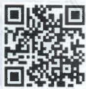
QR Code แบบสอบถาม