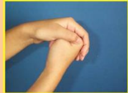
4. ใช้หลังมือถูฝ่ามือ