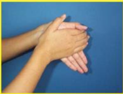
1. ใช้ฝ่ามือถูกัน