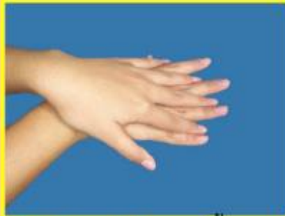
2. ใช้ฝ่ามือถูหลังมือ และนิ้วถูซอกนิ้ว