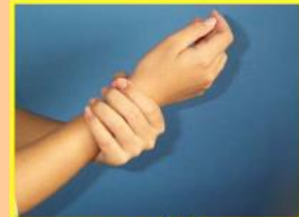
7. ถูรอบข้อมือ