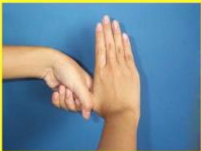
5. ถูนิ้วหัวแม่มือโดยรอบด้วยฝ่ามือ