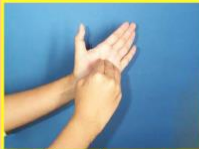
6. ใช้ปลายนิ้วถูขวางฝ่ามือ