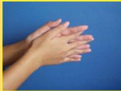
3. ใช้ฝ่ามือถูฝ่ามือ และนิ้วถูซอกนิ้ว