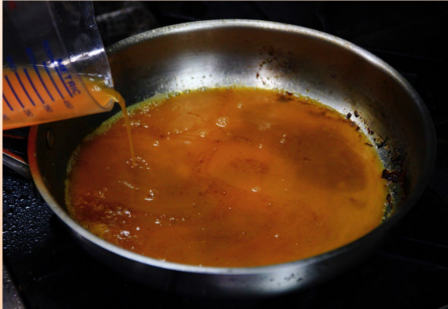
3. ใส่ส่วนผสมลงไป เคี่ยวไฟอ่อน ๆ