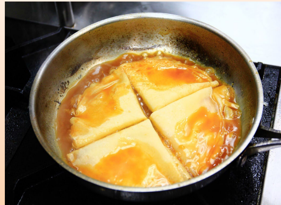
2. วางลงในซอสจนครบ 4 แผ่น