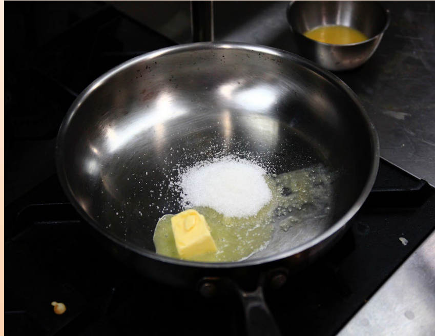
1. ใส่น้ำตาลทรายและเนยลงในกระทะ