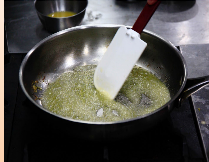
2. เคี้ยวน้ำตาลทรายและเนยให้เป็นคาราเมล