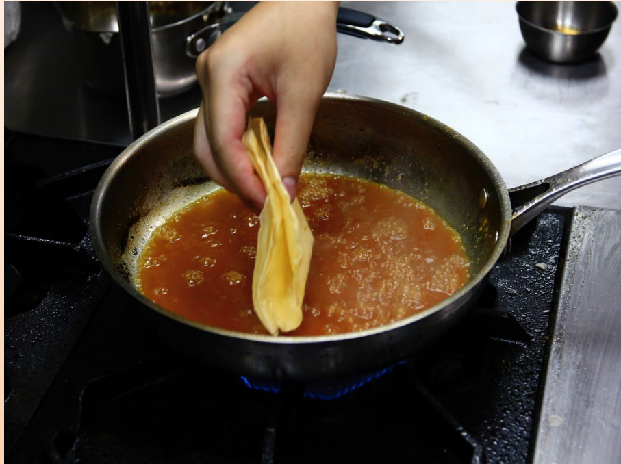
1. พับแป้งเครปเป็นรูปสามเหลี่ยม