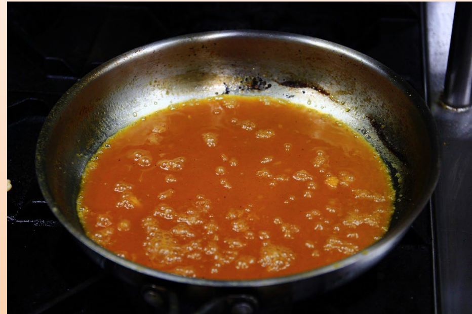
4. เคี่ยวส่วนผสมให้ระเหย จนซอสงวด